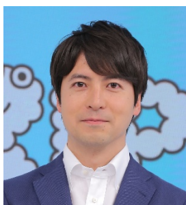
総合司会：梶 太一 日本テレビアナウンサー 東京湾再生アンバサダー