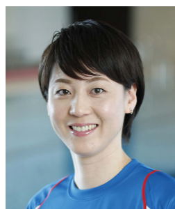
特別ゲスト：萩原 智子 日本水泳連盟理事 シドニー五輪競泳日本代表