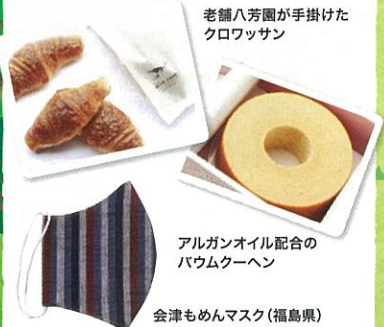
老舗八芳園が手掛けたクワワッサン

全国各地の森里川海の恵みや環境に優しい日用品が大集合。今年も被災地応援・復興マルシェも同時開催予定です。