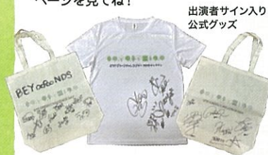
出演者サイン入り公式グッズ

各プログラムを巡るクイズに挑戦しよう！参加者には抽選で豪華景品をプレゼント。参加方法や景品詳細はホームページを見てね！