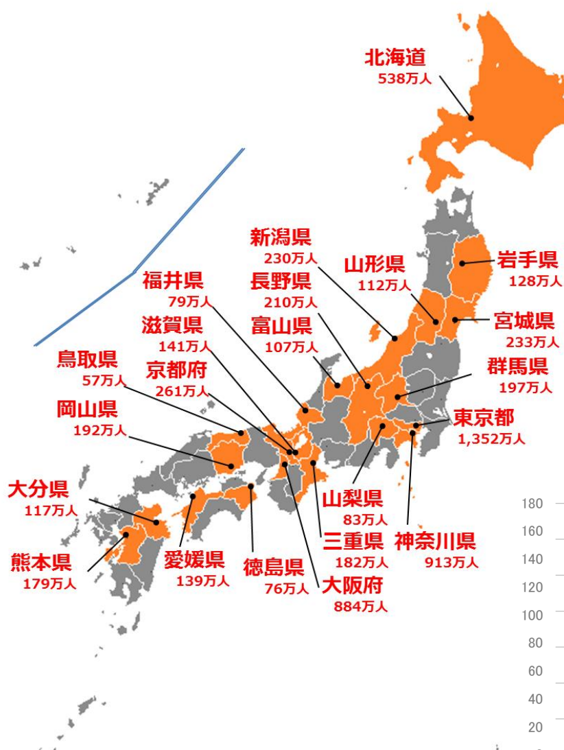
表明都道府県 (6,410万人)