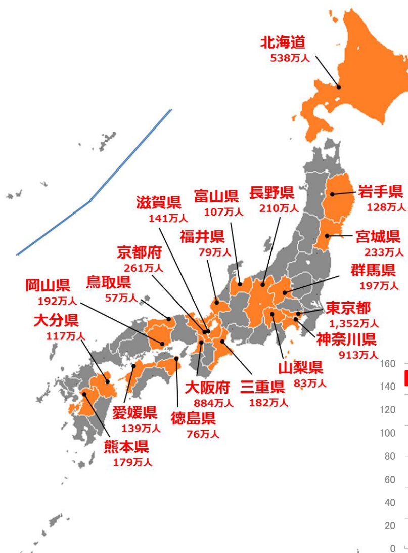
表明都道府県 (6,068万人)