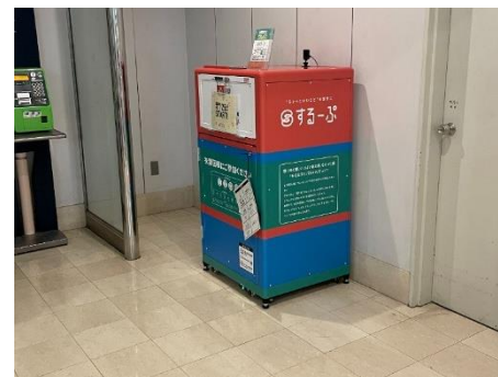
回収ボックス設置 @横浜ランドマークタワー