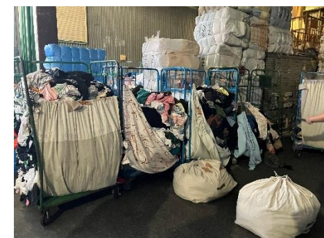
分別後の回収衣類