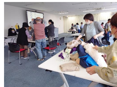
（リユースイベントの様子）