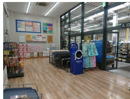
（店舗におけるPASSTO設置）