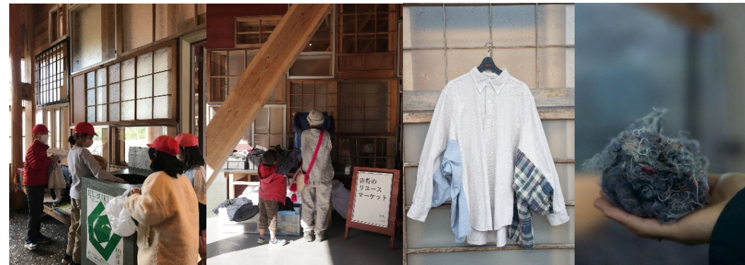
上勝町ゼロ・ウェストセンターでの回収の様子