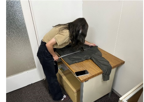
メルカリshops出品準備