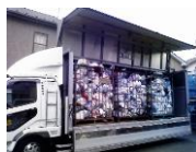
衣類の回収 (市中回収)