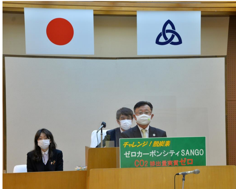
令和3年3月3日 第1回定例会

令和3年3月、未来を生きる世代に、かけがえのない豊かな自然環境をつないでいくため、森町長は、2050年までに三郷町のCO2排出量実質ゼロをめざすことを表明しました。