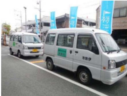
・ガソリン自動車2台