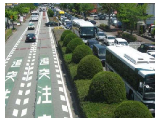
・伊勢市内の道路