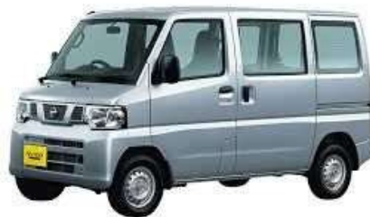
・ガソリン自動車 (イメージ)