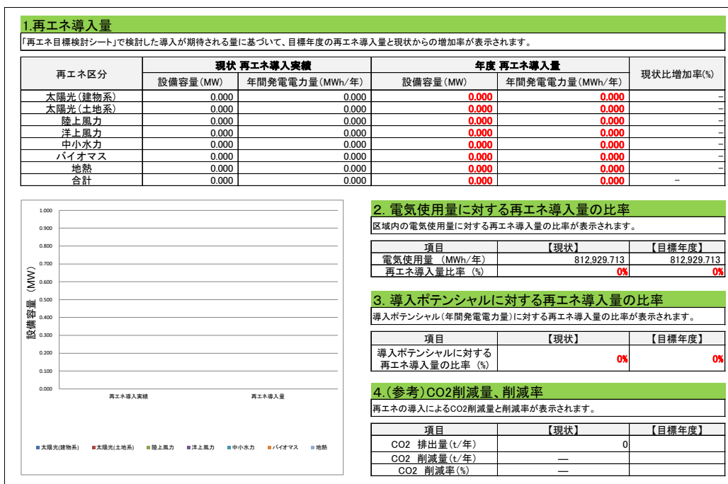
表 xx ○○町における再生エネルギー導入目標

再生エネルギー導入目標設定は様々な手法で検討することができますが、まず簡易的な手法として、REPOSの再生エネルギー目標設定支援ツールを活用することが考えられます。再生エネルギー目標設定支援ツールは、REPOSから再生エネルギー目標設定支援ツールを選択すると、都道府県又は市町村別のエクセルをダウンロードすることができます。再生エネルギー目標検討シート、必要に応じて(参考)促進区域検討支援ツールを利用した導入見込み量の整理シート(促進区域検討支援ツールとの連携シート)を入力することで再生エネルギー導入目標を設定することができます。まとめシートに整理される検討結果を再生エネルギー導入目標として活用することも考えられます。