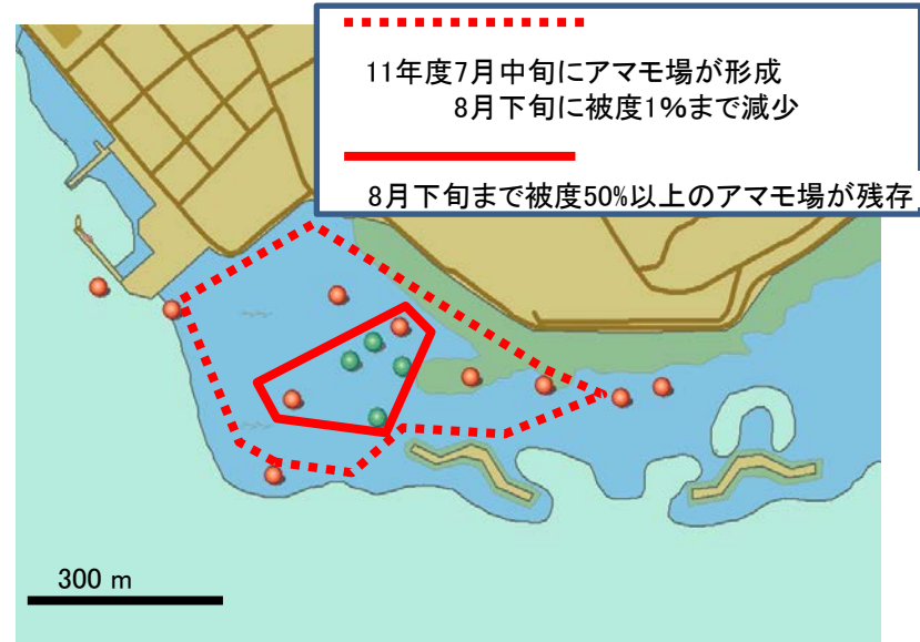
11年度広域調査結果