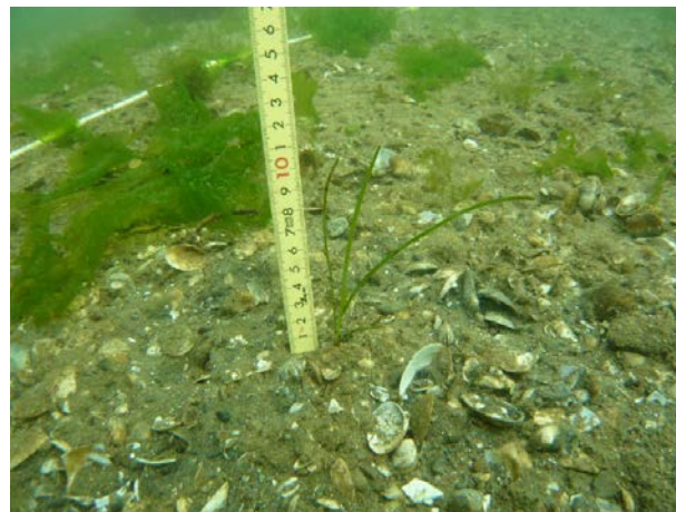
10年度冬季アマモ場消失。実生株確認。