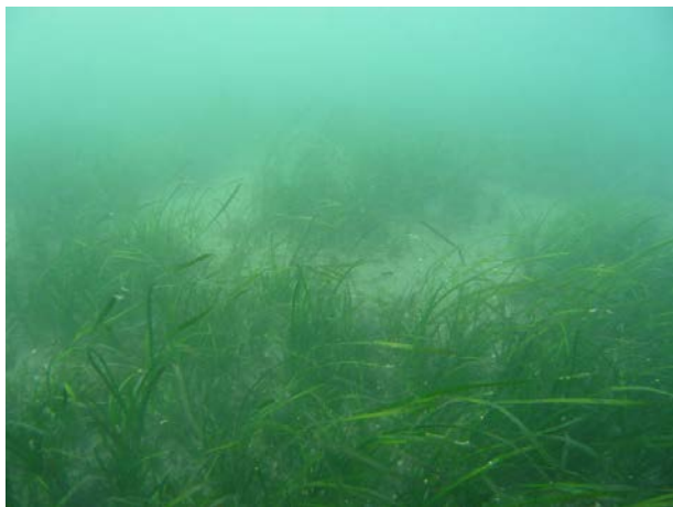
09年度冬季アマモ場残存