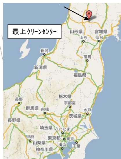
図-1.1.1 実証試験場所 最上クリーンセンター地図上の位置