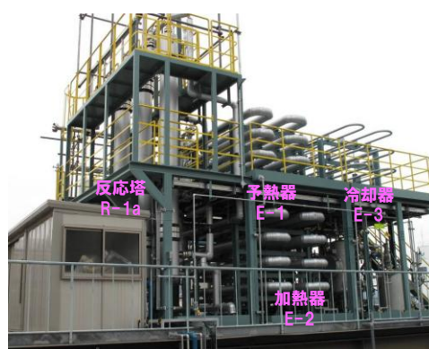
図 2 : パイロットプラント外観