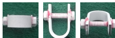
図 5：300 h 運転後浸透探傷試験結果