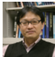
早坂 忠裕 （はやさか ただひろ） 専門は大気物理学。特に雲、エアロゾルの変動とその気候への影響。2002~2006 年度に総合地球環境学研究所で文理融合研究プロジェクト「大気中の物質循環に及ぼす人間活動の影響の解明」のプロジェクトリーダーを務めた。現在、東北大学総長特任補佐、大学院理学研究科副研究科長。