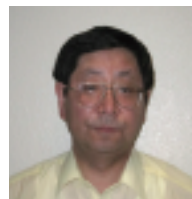
鈴木 克徳 （すずき かつのり） 環境行政に長年に渡り従事。国内対策を担当した後は、主として国際環境協力、国際交渉を推進。オゾン層保護対策や国連気候変動枠組条約交渉、京都議定書交渉等を担当し、また、世界銀行等多くの国際機関に勤務。近年はアジアの越境大気汚染問題の解決に尽力。