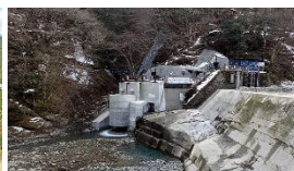
湘南ヘルマレ早戸川発電所 (小水力)