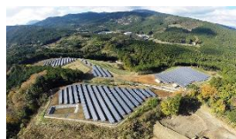
小田原メガソーラー市民発電所 (太陽光：第1期)