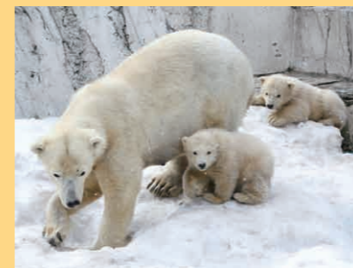
ホッキョクグマの親子

北極海の氷の上は、ホッキョクグマにとって狩りや子育てをするのに欠かせない場所です。ところが、地球温暖化の影響によって北極海の氷が減少し、狩りができずに栄養不足になったり、子育てに失敗するホッキョクグマが増えていています。2009年、カナダ政府と研究グループの調べでは、過去約20年間で、春先にほとんどエサをとらないホッキョクグマの数が2倍から3倍に増えたことが分かりました。