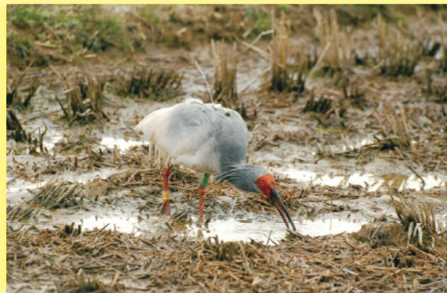
田んぼでえさをついばむトキ

自然共生社会を築いていくには、 地球に暮らすすべての 生きものを仲間と捉えて、 いつまでも仲良くして いきましょう。