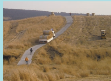
阿蘇草原における採草のようす

このため、平成10年からボランティアが野焼きに参加し、農業・畜産で野草の利用が進められています。近年では、秋の枯れた野草を集め、ガスにして、温水プールの電気と熱に利用する取り組みもはじまっています。この取り組みによって、二酸化炭素の排出を削減するとともに、草原の環境を守ることに貢献しています。