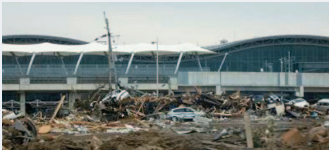
仙台空港駅前のがれき等の堆積状況