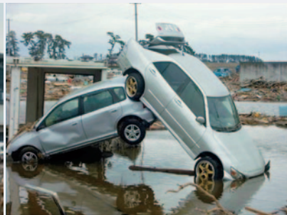
自動車の被災状況