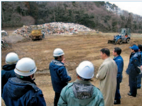
がれき等の仮置場