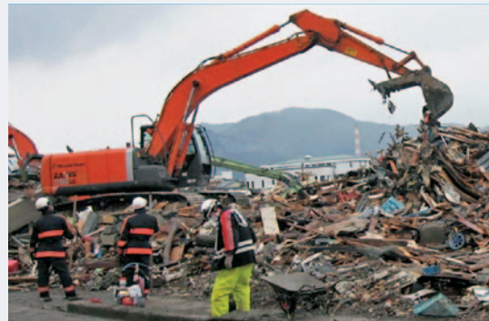
重機によるがれき等の撤去の状況