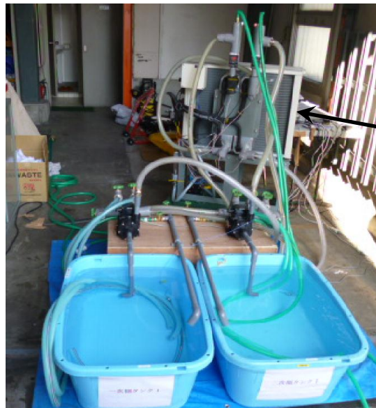
ヒートポンプ (背面)