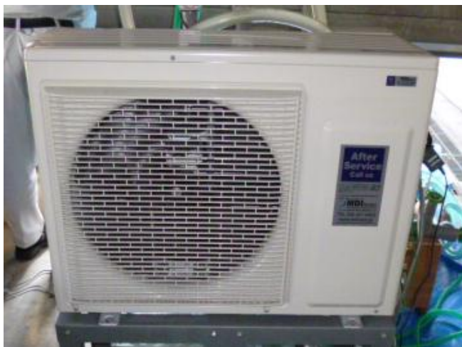
写真1 MDIHP-L-W/W の外形

実証対象技術であるMD I 簡易ヒートポンプチラーMDIHP-L-W/W は、地中熱、地下水熱、排水熱等を熱源に利用するヒートポンプチラーである。ヒートポンプを構成する圧縮機、凝縮器、膨張弁、蒸発器の内部を循環する冷媒には R410A を使用している。ヒートポンプと外部とで熱をやりとりする熱媒には、一次側 (熱源側)・二次側 (利用側) とともに水 (不凍液) を循環させるいわゆる「水-水ヒートポンプ」である。