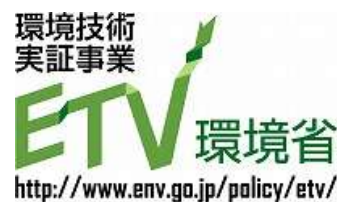
図-2 ETV ロゴマーク