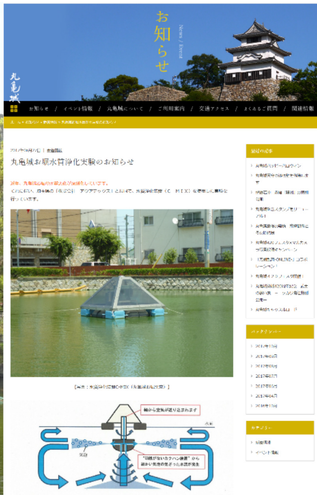
写真1 導入事例（丸亀城のお濠）