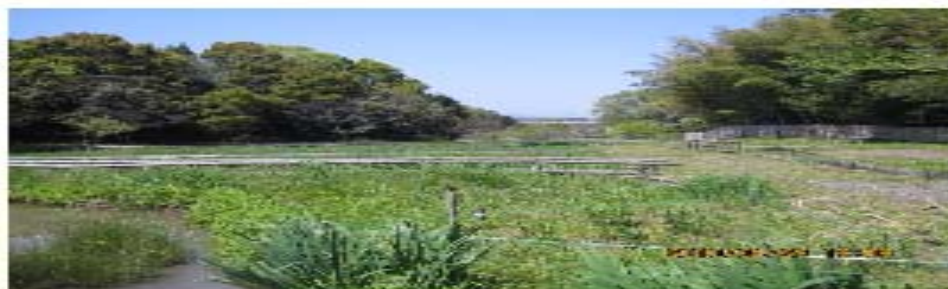
▲亀山里山公園(みちくさ)