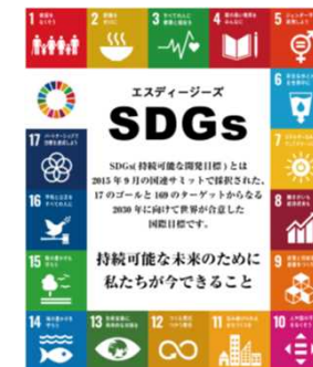
Shoyama Media Support Co., Ltd. 杉山メディアサポート株式会社 私たちは持続可能な開発目標 (SDGs) を実現しています。