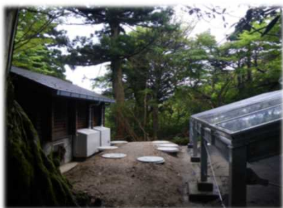
土壌処理式トイレ（新高塚小屋）

しかし、山岳部の厳しい気象条件やトイレまで何時間もかかることなどから、トイレの頻繁な故障や維持管理の労力、費用面などによる様々な問題が生じています。