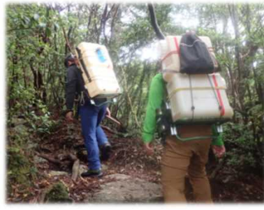
人力によるし尿搬出の様子

そのため【今後の屋久島山岳部におけるより良いトイレ・し尿処理の方向性】について、行政機関や関係団体、ガイド事業者などと一緒に、議論をしていく予定にしています。議論した内容は本誌やHPなどの場でも紹介していきたいと、皆さんも一緒に考えていただければありがたいです。