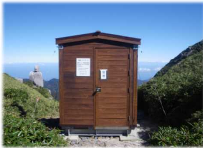
携帯トイレブース（翁岳）