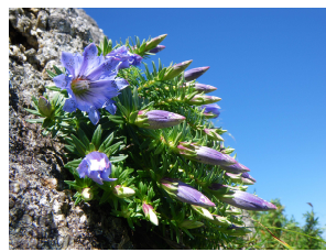
図. ヤクシマリンドウ