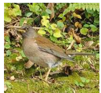
ツグミ科 シロハラ Turdus pallidus