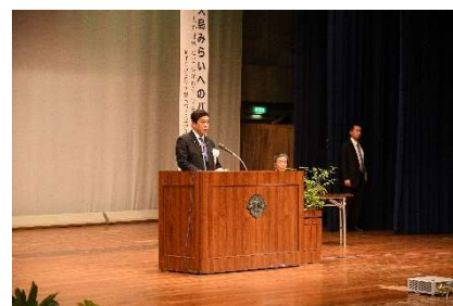
主催者挨拶（塩田知事）