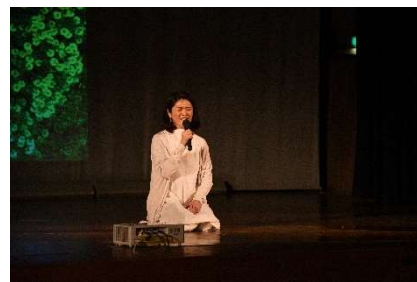
民謡「まつばんだ」披露