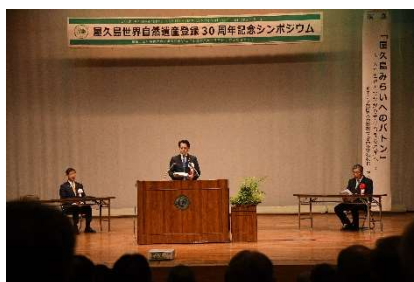
主催者挨拶（青山長官）