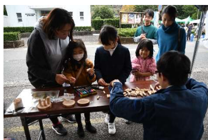
木工クラフト（森林管理署）