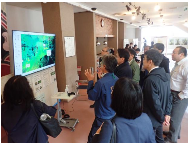
【3D画像の説明に聞き入る参加者】

会場内において、屋久杉巨樹・著名木47本の写真パネル展示及び縄文杉などの3D画像のコーナーを設け、子供から大人までゲーム感覚で楽しんでもらった。