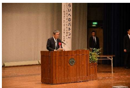
来賓挨拶（森山代議士）