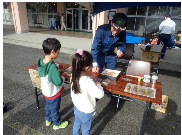
【木工教室を体験する子供】