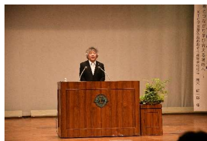
基調講演（茂木先生）