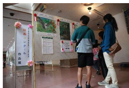
絵画作品展示（環境省）