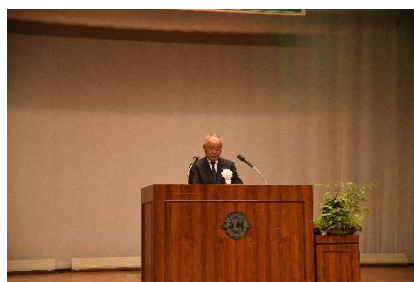
閉会あいさつ（町長）