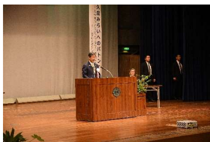
主催者挨拶（伊藤大臣）