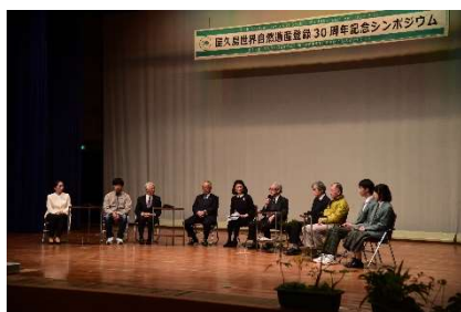
トークセッション