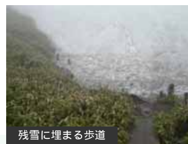
残雪に埋まる歩道

一帯はヒグマの高密度生息域のため、ヒグマ対策（クマスプレー、鈴等の装備やヒグマに出会わないための心得）が不可欠です。歩道は見通しが悪いため、自分の位置を知らせるなどして突発的な遭遇に十分に注意して下さい。