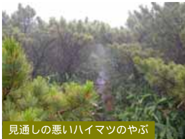
見通しの悪いハイマツのやぶ

5月～7月上旬は残雪で歩道が埋まり、ガス（霧）がかかりやすいため、大変迷いやすくなっています。また無雪期でもぬかるんでいたり、ササ、ハイマツのやぶとなっていたりするため、歩きにくくなっています。