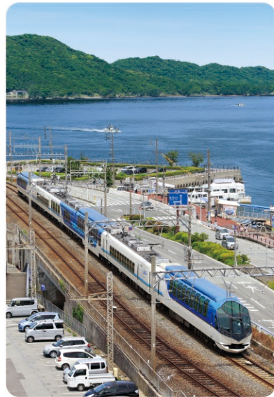
鳥羽市内を走る近鉄特急「しまかぜ」 Shimakaze Sightseeing Limited Express running in Toba City

お問い合わせ | 近畿日本鉄道株式会社 Kintetsu Railway Co., Ltd. - Contact - | ☎ URL 日本語 https://www.kintetsu.jp/cs/otoiawase.html English https://www.kintetsu.co.jp/foreign/english/index.html