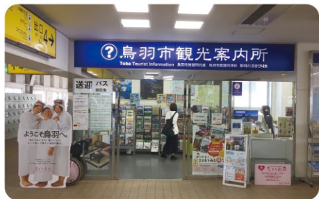
①鳥羽市観光案内所 Toba Tourist Information Center