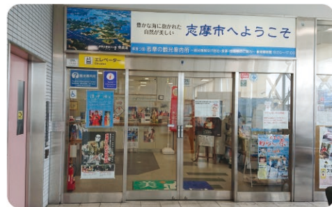
志摩市観光案内所 Shima Tourist Information Center

お問い合わせ | 一般社団法人 志摩市観光協会 Shima-city Tourism Association ☎ Tel +81-(0)599-46-0570 - Contact - ☎ URL 日本語 https://www.kanko-shima.com/ English https://www.kanko-shima.com/en/index.html