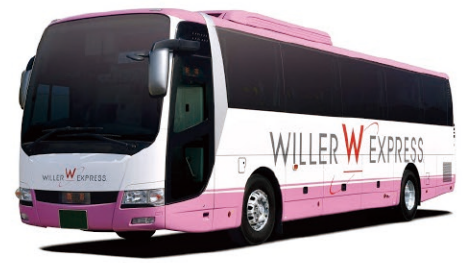
長距離バス Long Distance Coach

お問い合わせ | 株式会社 オリオンツアー ORION TOUR CO., LTD. - Contact - | ☎Tel +81-(0)50-5550-8772 (予約 Reservation) ☎URL https://www.orion-bus.jp/