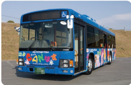
伊勢二見鳥羽周遊バスCANばす Ise-Futami-Toba Circular Bus “CAN Bus”

お問い合わせ | 三重交通株式会社 Mie Kotsu Co., Ltd. ☎ Tel +81-(0)596-25-7131（伊勢営業所 Ise Office） - Contact - | ☒ URL 日本語 https://www.sanco.co.jp/shuttle/inquiry.php