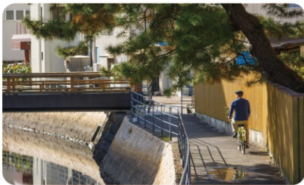
鳥羽市内のサイクリング Cycling in Toba City