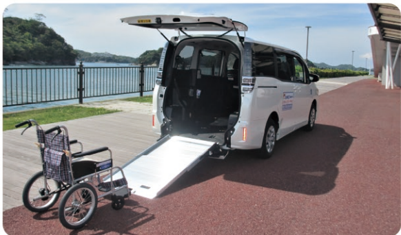
スロープ付き福祉タクシー Welfare taxi equipped with a wheelchair ramp