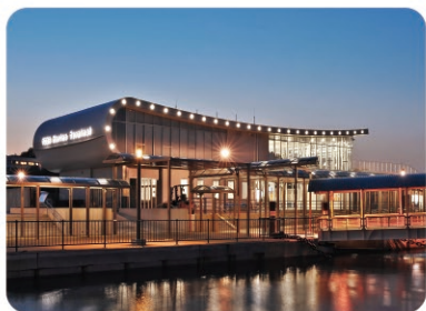
①鳥羽マリンターミナル Toba Marine Terminal