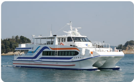
鳥羽市営定期船 Toba Municipal Boats

This regular liner operates five lines that connect Toba Port with the four remote islands in Toba City; Toshijima Island, Sugashima Island, Sakatejima Island, and Kamishima Island. You can use it to travel around the islands.