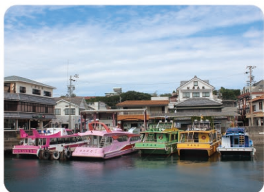
②賢島港 Kashikojima Port