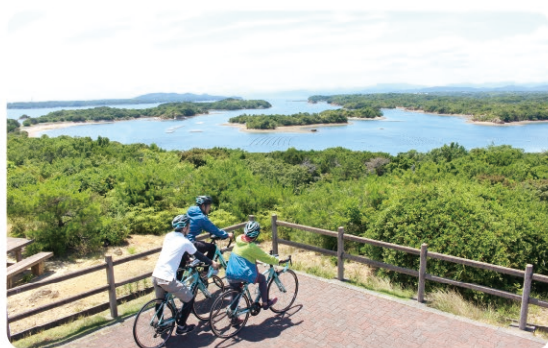
志摩市内のサイクリング Cycling in Shima City

お問い合わせ | Bicycle Station 志摩 Bicycle Station Shima - Contact - ☎ Tel +81-(0)599-44-4450 ✉ Email information@bicycle-journey.com 🌐 URL https://www.bicycle-journey.com/blank-2