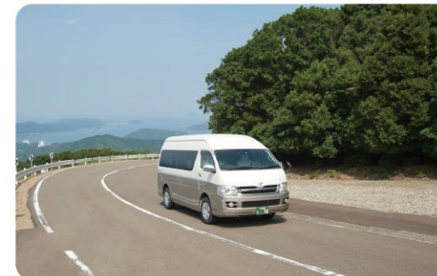
伊勢志摩スカイラインを走るタクシー(特定大型) Large taxi driving along Ise-Shima Skyline