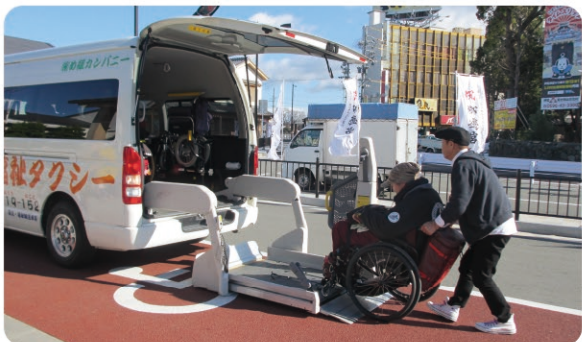
リフト付き福祉タクシー Welfare taxi equipped with a wheelchair lift