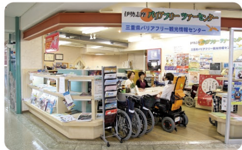
②伊勢志摩バリアフリースターセンター Iseshima Barrier Free Tour Center