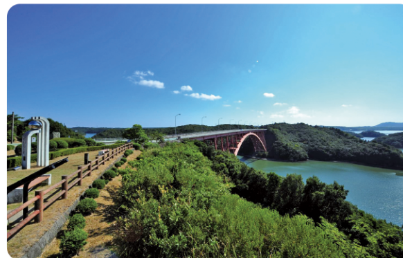
①パールロードの的矢湾大橋 Matoyawan-ohashi Bridge along Pearl Road

一般社団法人 志摩市観光協会 Shima-city Tourism Association ☎ Tel +81-(0)599-46-0570 🌐 URL 日本語 https://www.kanko-shima.com/ English https://www.kanko-shima.com/en/index.html