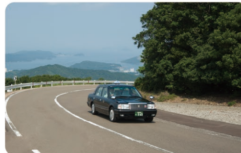
伊勢志摩スカイラインを走るタクシー(普通) Medium taxi driving along Ise-Shima Skyline

観光タクシー予約 Reservation of sightseeing taxi ☎ Tel +81-(0)596-28-3171 (予約 Reservation) 🌐 URL 日本語 https://www.miekintetsutaxi.co.jp/business/welcome.php English https://www.miekintetsutaxi.co.jp/business/welcome_en.php