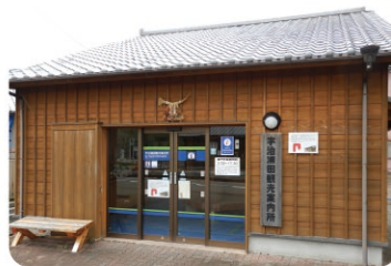
宇治浦田観光案内所 Ise Tourist Information (Ujiurata)

お問い合わせ | 二見浦観光案内所 Ise Tourist Information (Futamiura) ☎ Tel +81-(0)596-43-2331 - Contact - | ☎ URL 日本語 https://ise-kanko.jp/main/info/annai/ English https://ise-kanko.jp/main/english/