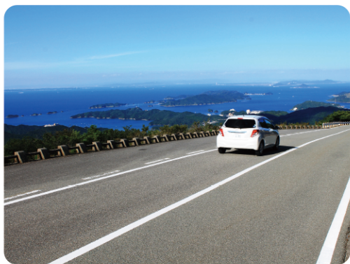
伊勢志摩スカイラインと鳥羽の海 Ise-Shima Skyline and the sea of Toba