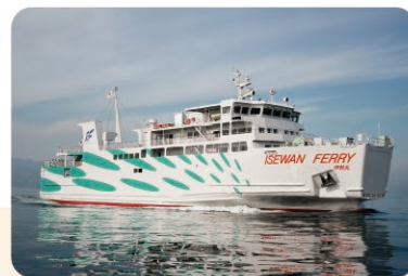
伊勢湾フェリー Isewan Ferry

This car ferry crosses Ise Bay and connects Toba with Irago at the tip of Atsumi Peninsula in Aichi Prefecture. A one-way trip usually takes about one hour, which is significantly less than the almost four-hour trip by car.