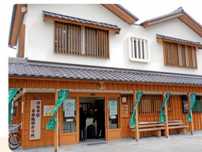
伊勢市駅手荷物預かり所 Ise-shi Station Baggage Storage

This is a baggage storage and delivery counter in front of the JR Ise-shi Station exit. For the delivery service, if your baggage is left between 9:00 a.m. and 1:10 p.m., it will be delivered to your accommodation in Ise City, Toba City, or Shima City (except for some isolated islands) by 5:00 p.m.