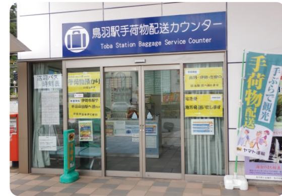
鳥羽駅手荷物配送カウンター Toba Station Baggage Service Counter

お問い合わせ | 鳥羽駅手荷物配送カウンター Toba Station Baggage Service Counter - Contact - ☎ Tel +81-(0)80-6698-9622 📠 URL http://www.toba.gr.jp/news/4787/