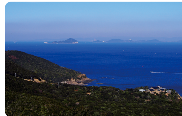
②パールロード沿いにある鳥羽展望台からの眺望 The view from Toba View Point along Pearl Road