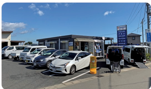
レンタカー Car rental shop

外国人予約・問い合わせ Reservation Center, TOYOTA Rent a Car 0800-7000-815 Toll-free within Japan ☎ Tel +81-(0)92-577-0091 URL https://rent.toyota.co.jp/eng/