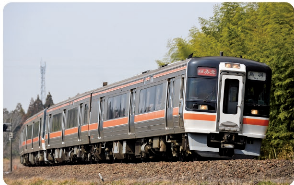
JR参宮線を走る快速みえ Rapid Mie running on the JR Sangu Line