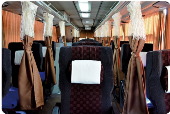
長距離バスの車内 Interior of Long Distance Coach

お問い合わせ | 三重交通株式会社 伊勢営業所 Ise Office, Mie Kotsu Co., Ltd. ☎Tel +81-(0)596-25-7131 - Contact - | ☎URL 日本語 https://www.sanco.co.jp/highway/ise-centrair/