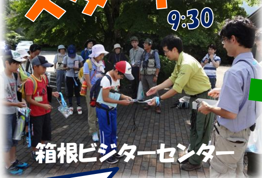
箱根ビジターセンター