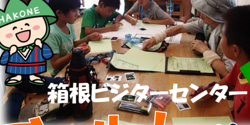
箱根ビジターセンター