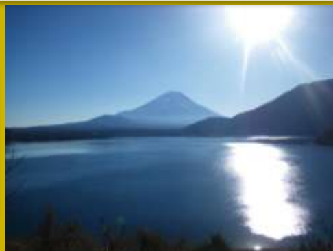
富士山と本栖湖 (2010年12月28日)