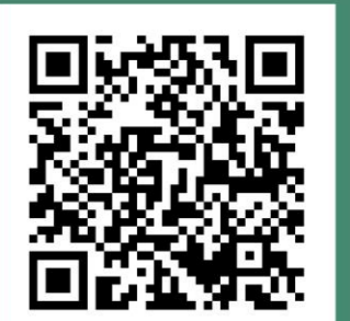
『登山等に関する通行規制等について』 北海道森林管理局