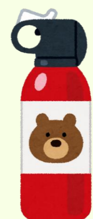
クマ撃退スプレー

クマ類に遭遇した際にとるべき行動 (クマ類の出没対応マニュアル-改定版- (環境省) 抜粋)