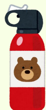
クマ撃退スプレー

クマ類に遭遇した際にとるべき行動 (クマ類の出没対応マニュアル-改定版- (環境省) 抜粋)