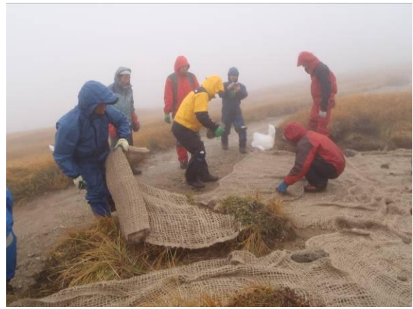
緑化ネットを敷設