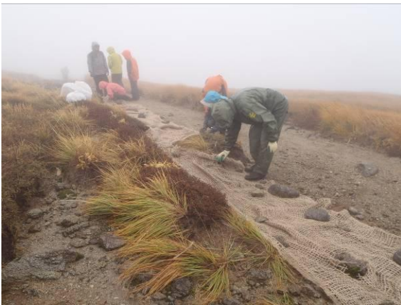
敷設後ピンで固定し、転石を設置