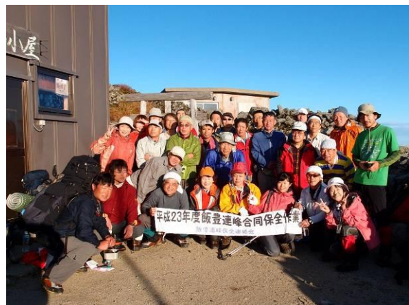
作業翌日に本山小屋で記念撮影