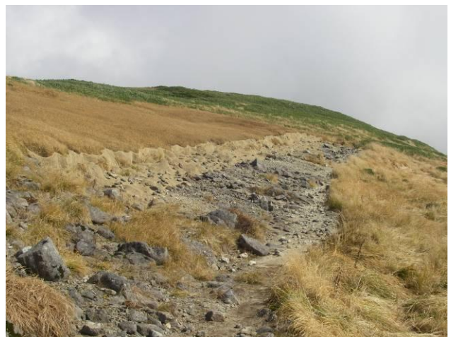
施工箇所① 作業終了