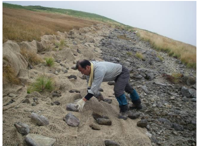
緑化ネットを敷設し、上から転石を置きます