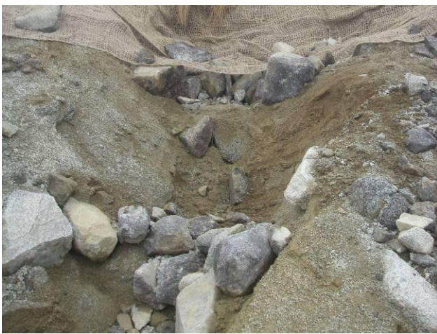
施工箇所① 土留工を設置