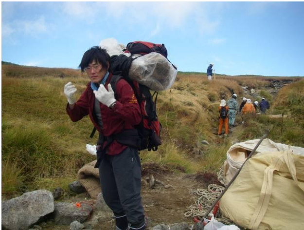
緑化ネットを施工箇所まで運搬します