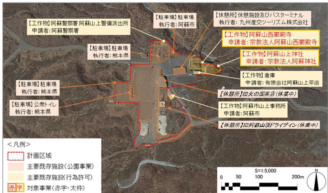
図：利用拠点整備改善事業ごとの実施場所