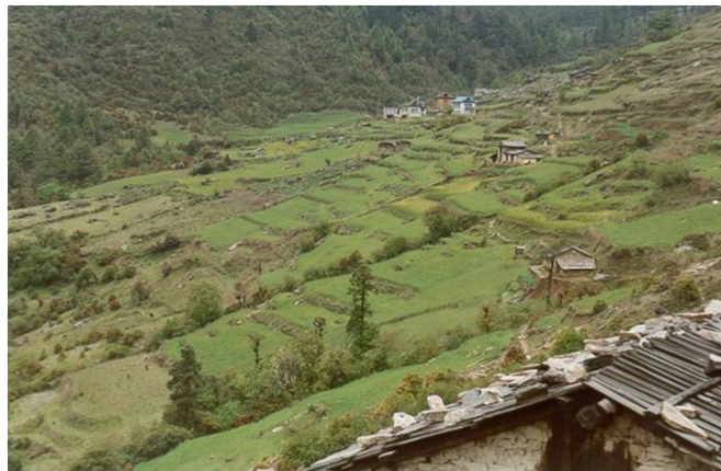
写真. ネパール、クンブ地域の集落と耕地