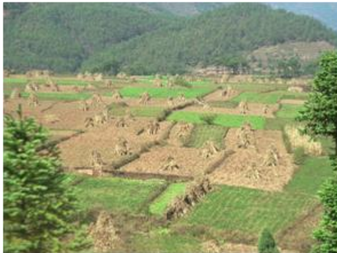
写真 ソバ、トウモロコシ収穫と飼料・燃料となる茎藁の乾燥 (昭覚県普詩郷玄生坦、2000年11月)