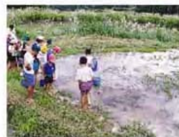
遊休棚田ビオトープ