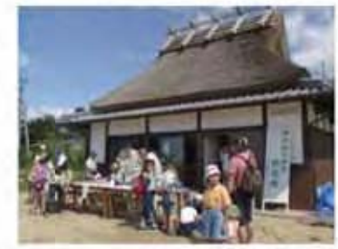
交流・拠点施設の例（神戸市西区神出町東）