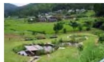
地域住民と企業、行政のグラウンドワークにより作られたビオトープ