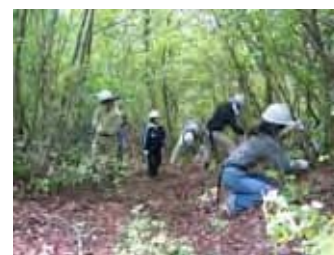
大学生らによる里山整備

【市民活動】 周辺には体験型のレクリエーション施設が立地しています。また、毛原地区では都市住民とともに棚田や里山を保全する活動が継続的に行われています。また、地元企業を巻き込んだグラウンドワークによる地域づくりも行われています。