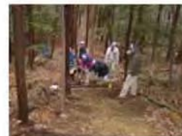
ボランティアによる散策道づくり

地区中央の展望ひろば周辺だけでなく、さらに里山の管理作業を広げていきたいと考えています。竹林が拡大しつつある神社の裏山などで竹の伐採を行い、良好な広葉樹林づくりを目指します。こうした活動を通じて棚田の水源である里山の環境を守ることで、おいしい棚田米づくりにつながることも期待できます。