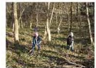
ボランティアによる下草刈り