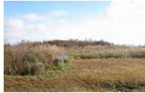
大江山山頂に広がるススキ草原

【里山利用の歴史】 かつては養蚕、和紙、和蠟燭、油など里山の恵みと豊かで清浄な水を利用した地場産業が発達していた地域です。現在でも丹後和紙の歴史と技を伝承する取り組みが続けられています。