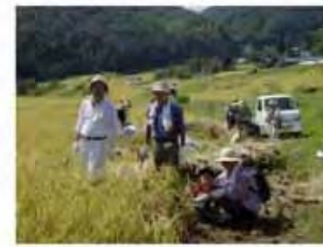
みんなで棚田保全に取り組む必要があります

里地里山活動の参加者のための交流・拠点施設について検討し、里地里山サポーターを拡大していくための条件を整えていきます。