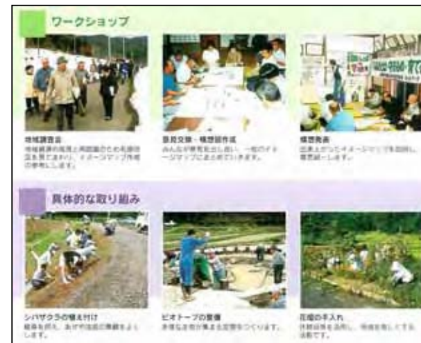
地域住民、企業、行政による様々な取り組み

【景観】 毛原集落には「日本の棚田百選」に選定された棚田景観がみられます。この美しい棚田は天水と周辺の里山から水を利用した伝統的な営農により維持されてきたもので、災害防止の機能も果たしています。