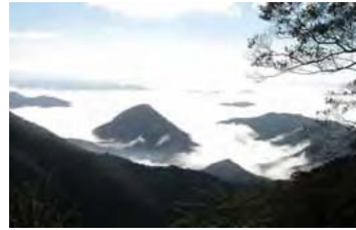
大江山山頂から望む雲海

【自然環境】 大江山連峰には希少な動植物やササ・ススキ草原、ブナ林など保存価値の高い自然環境が分布し、国定公園への指定が検討されています。また、展望のよい尾根沿いを縦走できるハイキングコースとして知られ、多くの登山者を集めています。