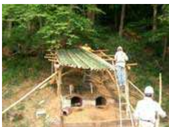
竹材の有効活用のための炭窯づくり