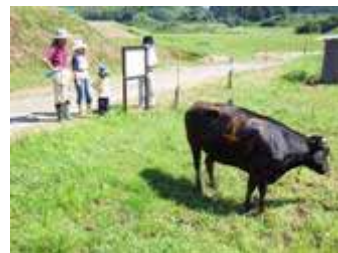
野生鳥獣との緩衝帯づくり