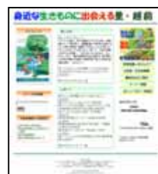
ホームページの開設