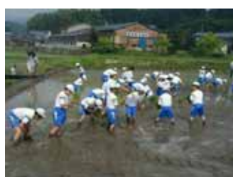
小学校の田んぼ体験