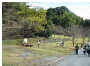
民間企業のウォーキングツアー