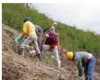
ダム管理所とボランティア団体による里山林再生活動