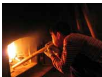
里山くらしの体験教育