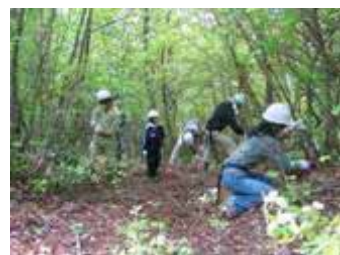
ボランティアによる散策路整備