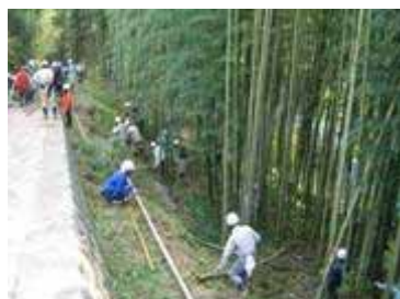
地域住民とボランティアによる竹林整備