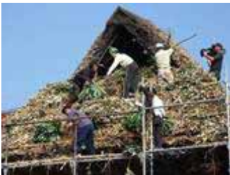
ササ葺き民家の再生