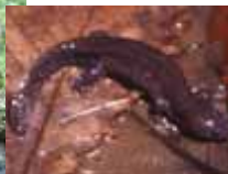
アベサンショウウオ