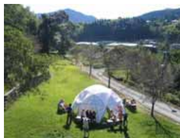
竹材の新たな活用(竹ドーム)