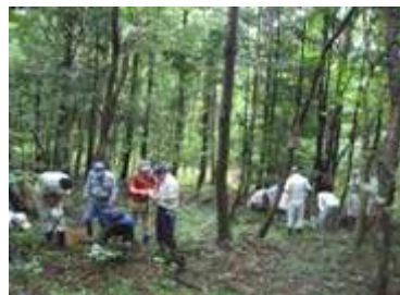
里山林の整備 (生物生息調査)