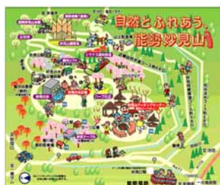
民間企業による里山散策コース