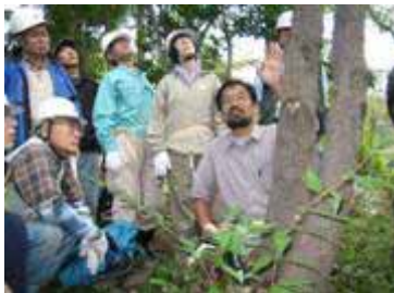
専門家による研修の実施