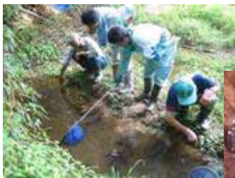
希少野生生物調査