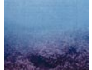
浮泥などによる水の濁り