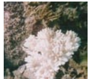
サンゴの白化現象

阿波竹ヶ島海中公園は、徳島県と高知県の県境に位置し、黒潮分岐流の影響を受け透明度が高く、鮮やかな緑色のエダミドリイシの大群集やシコロサンゴなどの生物群集が織りなす海中景観の美しさから、1972年に海中公園に指定されました。