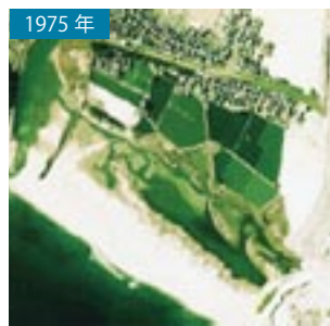
1975年 かつての蒲生干潟