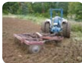
天然下種更新補助作業

林縁にある樹高の高いブナの母樹周辺で天然下種更新の可能性が高い箇所では、土壌改良材等の散布と耕耘により、鳥や風によって運ばれた種子の発芽と生長に必要な土壌の軟度、土量が確保されるように配慮します。