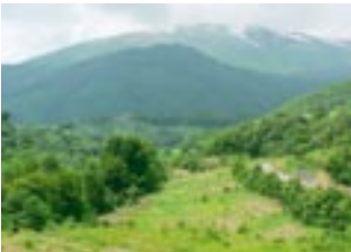
事業箇所内の草地

設立日：H17.7.19 構成員数：21 全体構想作成日：H18.3.31 実施計画作成日： ● H18.10.20 (森吉山麓高原／秋田県) (H21.3 現在)