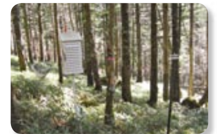
環境条件調査・種子量調査の状況