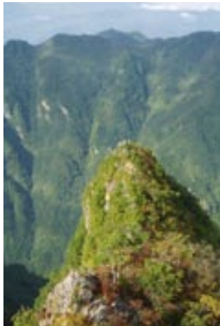
大蛇窟（だいじゃくら）