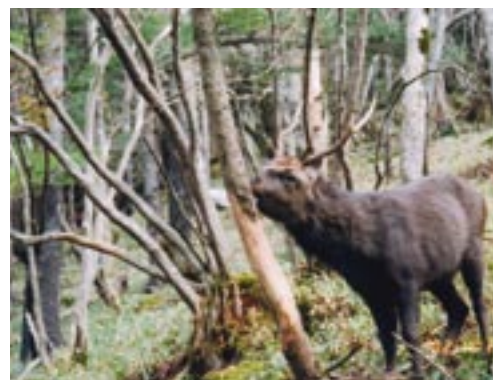
ニホンジカによる樹木の剥皮が生じている