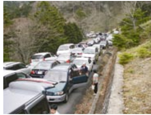
ドライブウェイの開通によって利用者が増えたことも、自然環境へ負荷を与える一因となっている