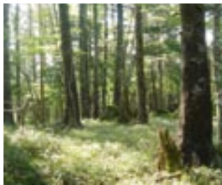
東大台（トウヒ林） 近畿地方では希少なトウヒやウラジロモミが優先する亜高山性針葉樹林やブナが優先する冷温帯性広葉樹林がまとまって残っている