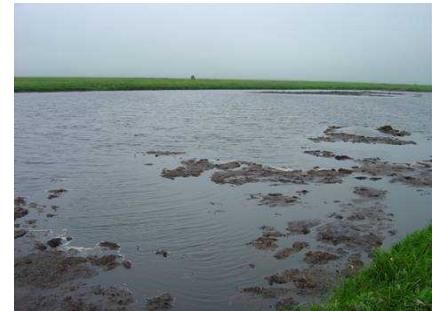
泥炭採掘跡地の開放水面