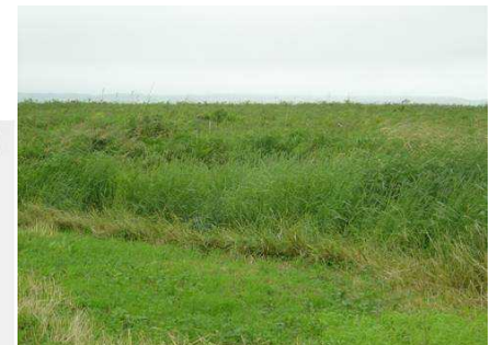
農地の地盤沈下 手前の牧草が奥の湿原より 1mほど低くなっている