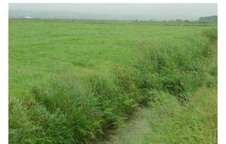
排水路の設置による乾燥化の進行 湿地に隣接する農地での排水不良