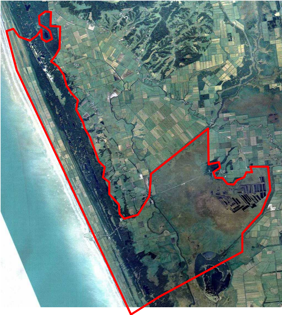
自然再生の対象となる区域(全体構想より)