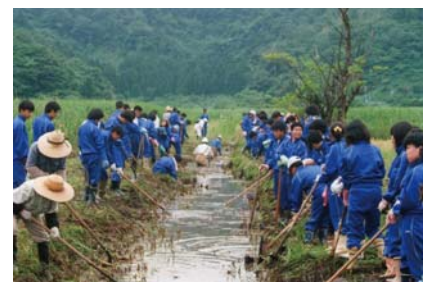
伝統的な水路管理の江掘り

多様な生きものを育む場としての中池見湿地を維持するため、管理行為は不可欠ではあるが、湿地のほとんどは耕作放棄され、その担い手がいないのが現状である。そのため、地元的环境保全団体や敦賀市などが協働でこうした活動をおこなっている。また、地域の学校が環境教育の場として中池見湿地を利用しつつ、外来種の進入状況調査や駆除といった活動を進めている。