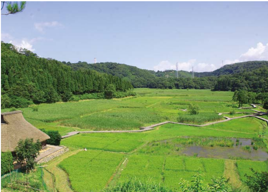
南東から見た中池見湿地