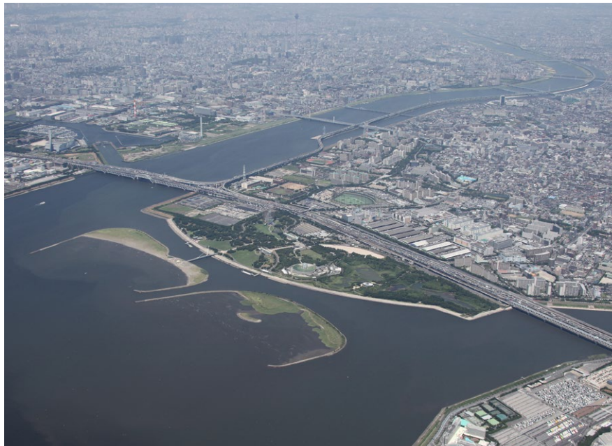
南東上空から見た葛西海浜公園