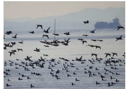
乱舞するスズガモ(冬)

葛西海浜公園は都心から公共交通機関を利用してのアクセスがよく、多くの人々が海の自然に触れ、海の魅力を体感する場となっている。西なぎさでは、干潟の生き