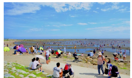
西なぎさで遊ぶ人々

もの、野鳥及び魚類の観察会、海苔すき体験、海水浴体験、釣りなど様々なレクリエーションを楽しむことができる。