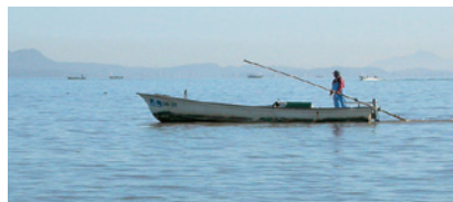
シジミ漁のようす

松江市役所 Tel: 0852-55-5555 出雲市役所 Tel: 0853-21-2211 島根県庁 Tel: 0852-22-5111