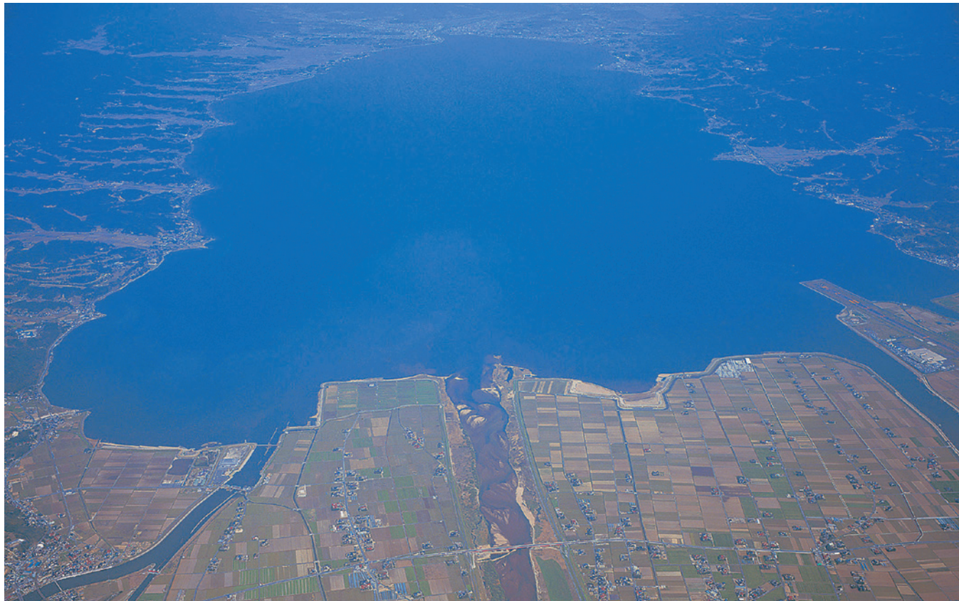
西から見た宍道湖の全景