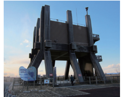
湿地を見渡せるウォッチングタワー